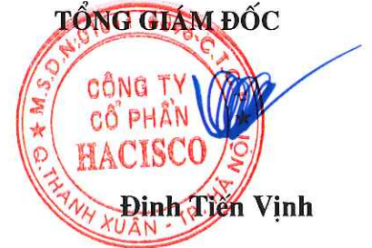
Đinh Tiên Vịnh